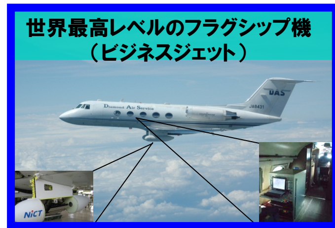
世界最高レベルのフラグシップ機 (ビジネスジェット)